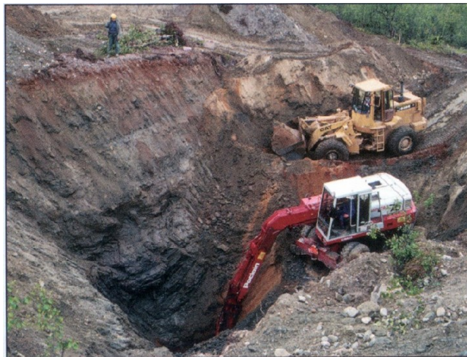
Leting etter gull i fjell under tykt morenedekke krever tung redskap. Sáotgejohka 1990.